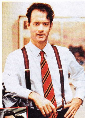
▲ RANK & SCHLANK In „Philadelphia“ (1993) ist Tom noch dünn

Richtig ernst scheint er die Schock-Diagnose nicht zu nehmen. Im Gegenteil – er riskiert sogar sein Leben! „Man sagte mir, dass ich komplett geheilt werden könne, wenn ich das wiegen würde, was ich auf der Highschool gewogen habe. Aber auf eine strikte Diät habe ich einfach keine Lust. Ich werde dann wohl weiterhin mit der Diabetes-Erkrankung leben müssen“, erklärt Hanks. Rummms, eine Aussage wie ein Paukenschlag. Denn die Schäden, die Diabetes bei Nichtbehandlung anrichten kann, sind verheerend (s. Kasten r.). Außerdem zeigen neue Untersuchungen, dass Diabetiker häufiger an Demenz und Depressionen erkranken. Warum setzt der vierfache Vater seine Gesundheit so leichtfertig aufs Spiel? Weshalb tut er seiner Frau das an? Seit 25 Jahren