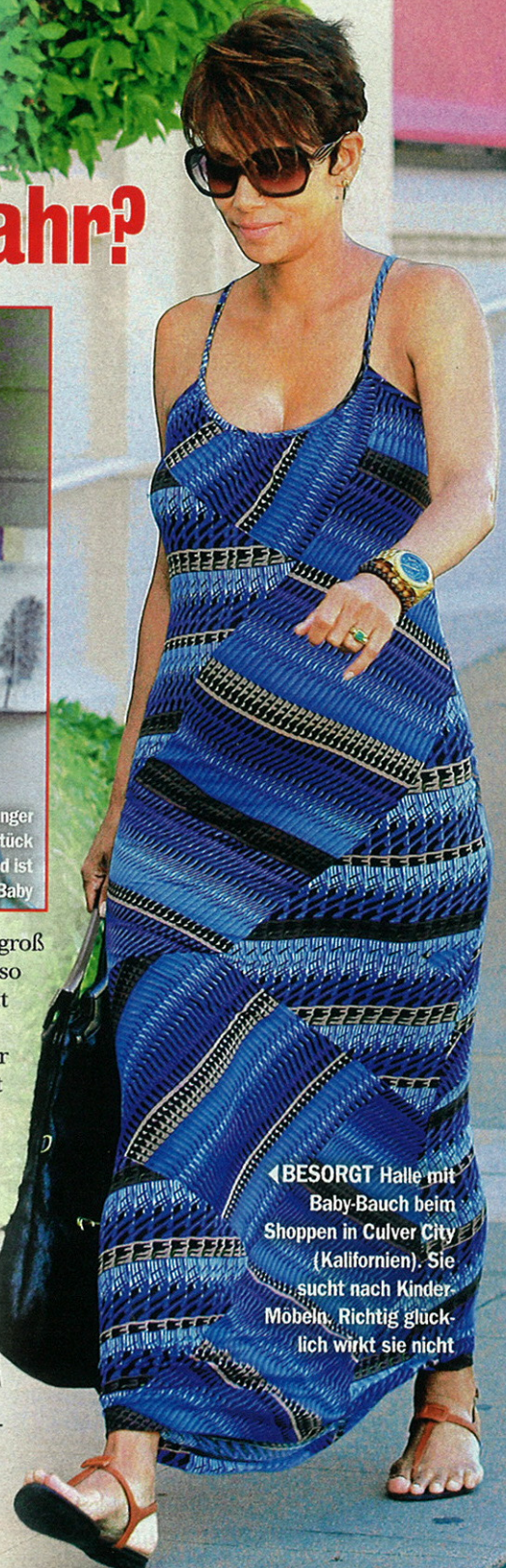
◀ BESORGT Halle mit Baby-Bauch beim Shoppen in Culver City (Kalifornien). Sie sucht nach Kinder-Möbeln. Richtig glücklich wirkt sie nicht